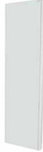
DİKEY DÜZLEM YÜZEYLİ