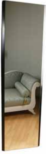
AYNALI DİKEY DÜZLEM YÜZEYLİ