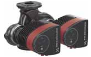
MAGNA1 D İKİZ POMPA