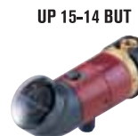
UP 15-14 BUT